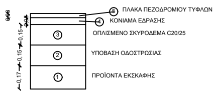
ΛΕΠΤΟΜΕΡΕΙΑ ΟΔΗΓΟΥ ΤΥΦΛΩΝ