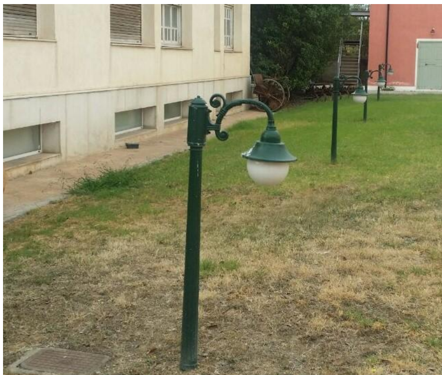
Φωτό 4: Εξωτερικό φωτιστικό περιβάλλοντος χώρου Γεωργικού Μουσείου

Τα νέα φωτιστικά μπορεί να είναι του σχεδίου της φωτό αλλά και λίγο διαφορετικά. Θα κατατεθούν τρεις προτάσεις – σχέδια του φωτιστικού που όλες θα καλύπτουν τα τεχνικά χαρακτηριστικά της μελέτης. Η τελική επιλογή θα γίνει από την επιτροπή του διαγωνισμού.