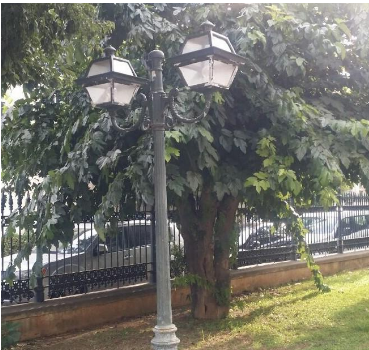
Φωτό 2: Εξωτερικό φωτιστικό περιβάλλοντος χώρου κτ. Παπαδάκη

Στον περιβάλλοντα χώρο του κτ. Παπαδάκη (φωτό 2) θα τοποθετηθούν ιστοί φωτισμού ύψους 3,0 m περίπου, οι οποίοι θα φέρουν δύο φωτιστικά σώματα παραδοσιακού τύπου (φανάρι) επί του ιστού, χρώματος πράσινο.