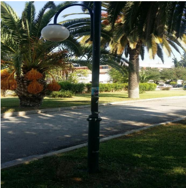
Φωτό 1: Εξωτερικό φωτιστικό δρόμου φοινίκων

Τα νέα φωτιστικά μπορεί να είναι του σχεδίου της φωτό αλλά και λίγο διαφορετικά. Θα κατατεθούν τρεις προτάσεις – σχέδια του φωτιστικού που όλες θα καλύπτουν τα τεχνικά χαρακτηριστικά της μελέτης. Η τελική επιλογή θα γίνει από την επιτροπή του διαγωνισμού.